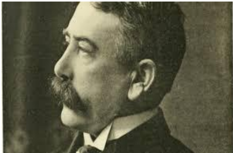
فيرناند دي سوسير

ئهم قه‌سيده‌يه ئيستاشي له‌گه‌لدا بيت كاريگه‌ريي خوي له‌سه‌ر كو‌مه‌لگاي ته‌كنه‌لوژي سه‌ده‌ي بيست و يه‌ك جي‌هيشتووه‌و هيمني و هارمونييه‌تي سروش ده‌به‌خشيت به‌خه‌يالي خوينه‌ر.(4)