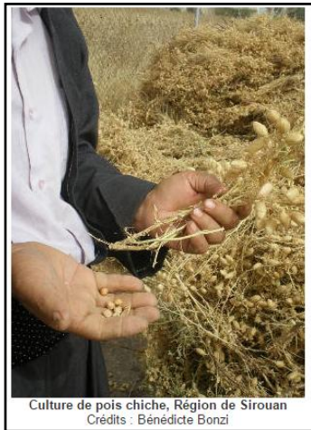
Culture de pois chiche, Région de Sirouan

ئەم بەرنامەيەكە بەشىۋەيەك دارىژراوۋە كە جووتىياران ھان نا دات بۇ ئاۋەدانكردنەوۋى گوندە رووخاۋەكانيان تا جارىكى تر بيان خەنەوۋە بوارى وەبەرھەمەينان (استسمار) . ئەو ئاردە كە لە بايى دابەش دەكرىت بە نمونە وەردەگرين , زۆر لايەنى ئالۆز و نادىارى ئەم بەرنامەيە بە باشى دەردەخات . ئايا ئەو ئاردە بە چەند كپاۋە ؟ تا حكومەت بەخۇرايى دابەشى دەكات . كى ئارد دەكرى كاتىك كە بە خۇرايى پىى دەدرىت ؟ 9 . ئەمە مۇدىلىكى نوپى سىستەمى بەرھەمەينانى كشتوكالىە كە لە رىى ھاوكارى خۇراكەوۋە دەسەپىنرىت , كە نرخی خۇراك دەبەستىتەوۋە بە بازارى نىۋدەولتەتيەوۋە , چىتر ئەو شوينەى جووتىيار رۇژانە كشتوكالى تىدا دەكات , بۇى نا بىتە سەرچاۋەيەكى بەرھەمەينەر , بۇيە ئەو خەلگەى كە جاران جووتىيار بوون ئىستاش لە شارەكان دەمىنەوۋە و مووچەيەك وەردەگرين چونكە بە قوربانى جەنگ دەژمىرىن , يان كارىكان پى راسپىراۋە لە دامەزراۋەيەكى حكومىدا . لە ئەنجامدا ئەمرۆ نىكەى 70% ى دانىشتوانى كوردستان پارە لە